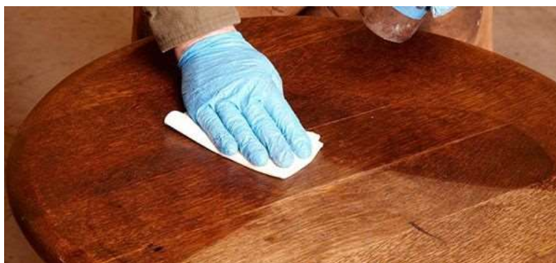
شاپان- آستر کاری با شاپان با استفاده از پارچه

در این روش با استفاده از یک تکه تنظیف یا پارچه تمیز و بدون پرز، شاپان را روی چوب مالیده و به آرامی یکدست کنید. هرچه پرز پارچه کمتر باشد، نتیجه کار بهتر و تمیزتر خواهد بود. اگر از رنگ حاصل شده راضی نیستید و از رنگ مورد نظر شما پر رنگ تر شد، می توانید پارچه را