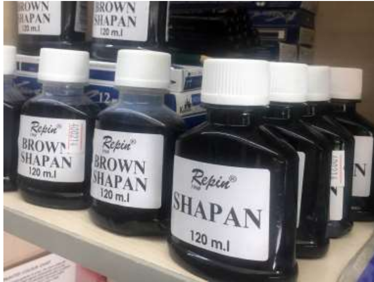
شاپان- آستری‌های رایج برای رنگ کاری چوب

در مراحل رنگ کاری چوب و سازه های چوبی، مرحله ای وجود دارد که قبل از اجرای رنگ اصلی، روی چوب آستر می زنند. آسترهای موجود در بازار به دو نوع آسترهای روغنی و آسترهای حلال در آب تقسیم بندی می شوند. استفاده از آسترهای حلال در آب کمتر رایج است؛ چون زمان بیشتری برای خشک شدن لازم دارند و اکثر رنگ کارها ترجیح می دهند که از آسترهای روغنی استفاده کنند. یکی از معروف ترین و پر کاربردترین آسترها برای رنگ کاری چوب، شاپان است که گاهی به آن شاپون هم گفته می شود. از قدیم برای تغییر رنگ چوب به رنگ های قهوه ای و رنگ های مشابه، از شاپان استفاده می کردند. شاپان در واقع رنگ نیست، ولی اصطلاح "رنگ شاپان" به غلط شایع شده است. جالب است بدانیم که در گذشته از پوست گردو به جای شاپان استفاده می کردند.