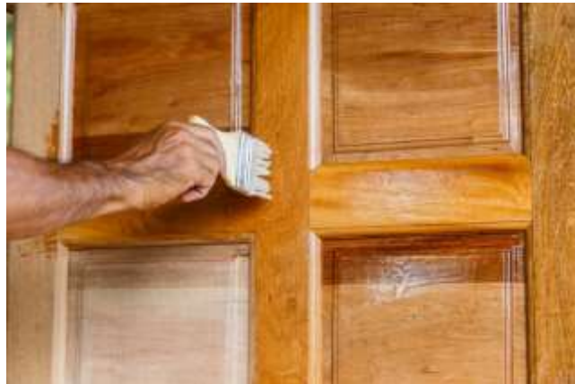
شاپان- آستر کاری با شاپان با استفاده از قلم مو

اجرای شاپان روی چوب با استفاده از قلم مو