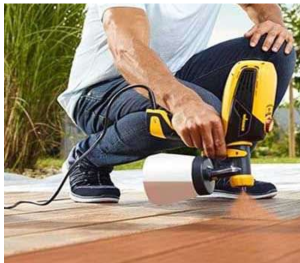
شاپان- آستر کاری با شاپان با استفاده از پیستوله

اجرای شاپان روی چوب با استفاده از پیستوله