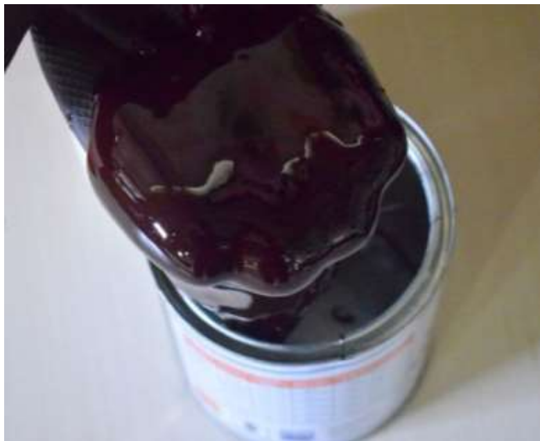
شاپان- شاپان نیاز به رقیق شدن با حلال دارد

افراد مختلف از حلال های مختلف برای حل کردن شاپان استفاده می کنند که از جمله آن ها می توان به تینر روغنی، نفت، گازوئیل، بنزین و غیره اشاره کرد. از بین این حلال ها، بنزین مناسب ترین است؛ زیرا بقیه آن ها بعد از خشک شدن هم حالت روغنی بودن به آستر می بخشند و این امر به دلیل وجود مواد روغنی درون آن ها است و از طرف دیگر، زمان خشک شدن آستر را هم زیاد می کنند؛ ولی بنزین فرار است و علاوه بر این باعث می شود که رنگ آستر زودتر خشک شود و لایه روغنی تولید نمی کند؛ چون روغن ندارد.